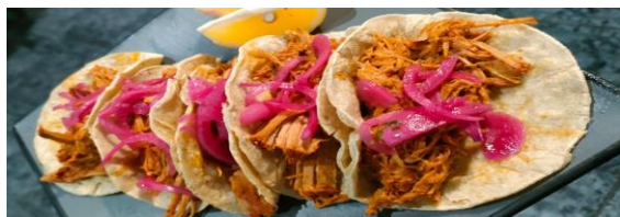
Tacos de Cochinita Pibíl