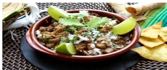
Centro de Carnitas