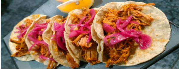
Tacos de Cochinita Pibíl