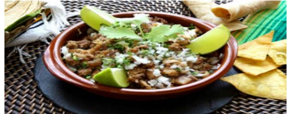
Centro de Carnitas